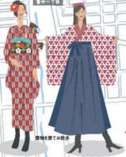
着物を着てお散歩