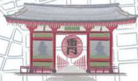
浅草のシンボル、雷門